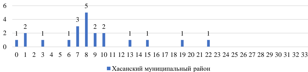
Рисунок 4. Распределение первичных баллов по биологии

На рисунке 4 представлено распределение первичных баллов по муниципалитету по количеству участников.