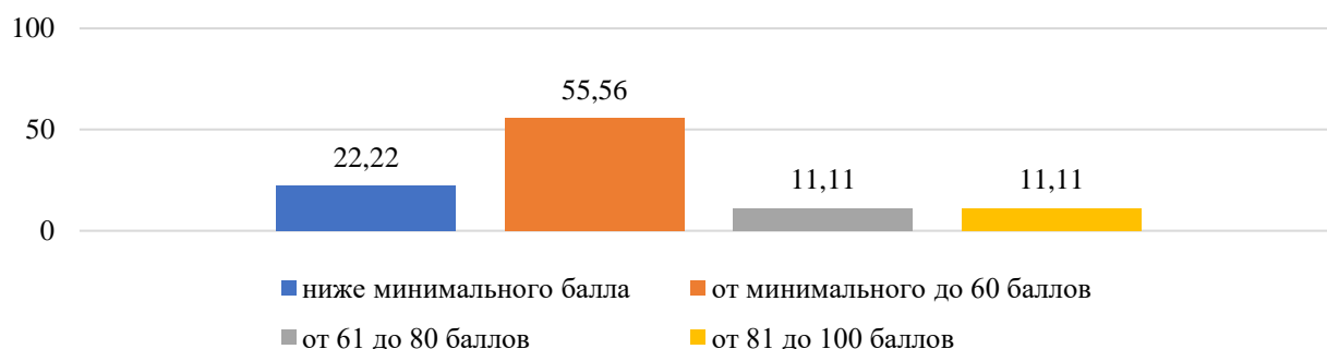
Рисунок 1. Основные результаты ЕГЭ по биологии

Основные результаты ЕГЭ по биологии в Хасанском муниципальном районе в 2023 году представлены на рисунке 1. В 2023 году в образовательных организациях (далее – ОО) муниципалитета не было выпускников, получивших на экзамене по биологии 100 баллов.