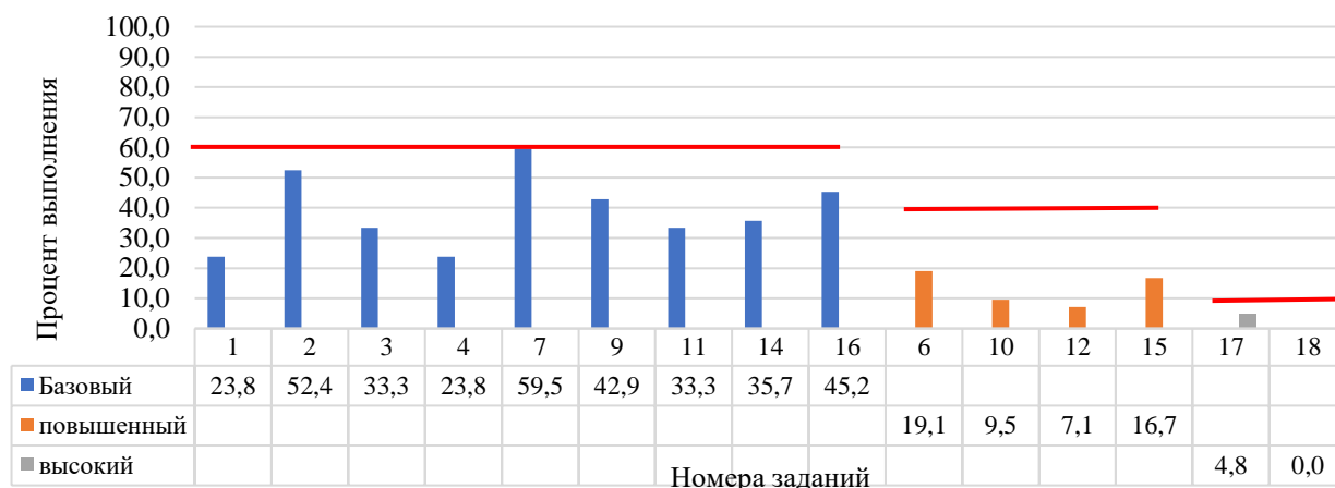
Рисунок 5. Задания, по которым участники не преодолели минимальный порог

На рисунке 5 представлены данные по заданиям (%), уровень выполнения которых не преодолел минимальный порог. Красной линией отражен минимальный порог выполнения для каждого уровня сложности: базовый – 60%, повышенный – 40%, высокий – 10%.